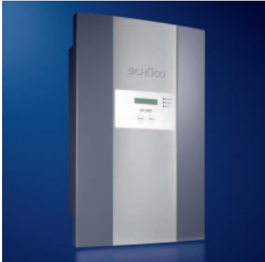
Die Schüco Wechselrichter der SGI-Baureihe können einfach mit dem Datenlogger verbunden werden